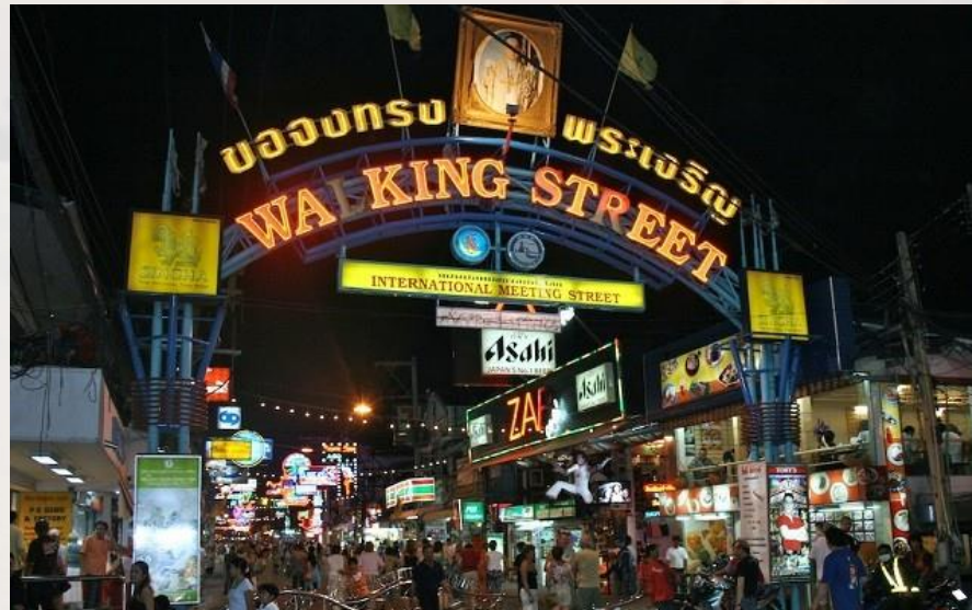
La walking street aujourd'hui