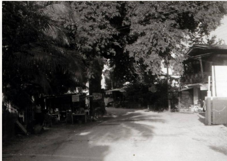
La walking street à l'époque