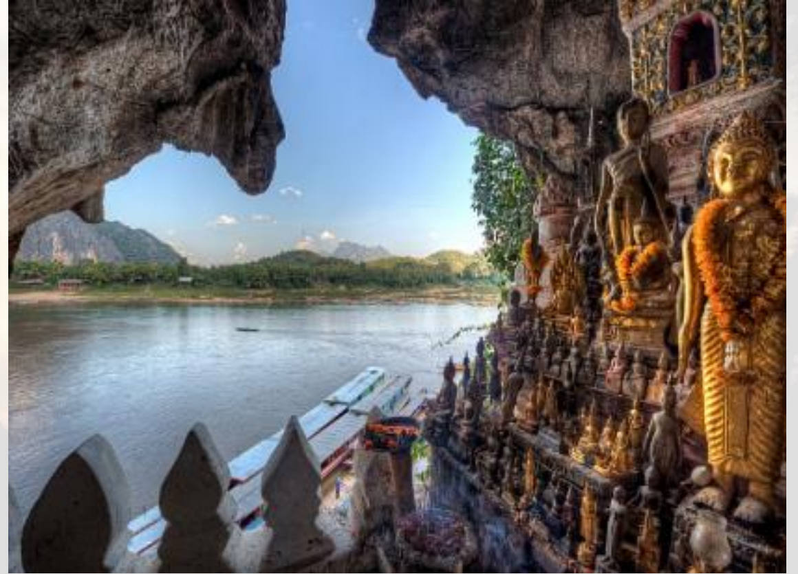
LES GROTTES DE PAK OU