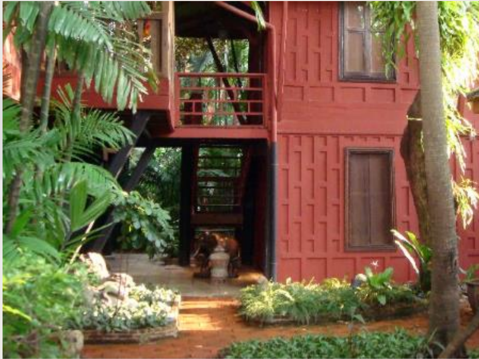
Les pavillons qui datent du XIXe siècle ont été reliés entre eux par des corridors.

La façade discrète de la maison s'ouvre dans un hall d'entrée décoré avec goût, lui-même une caractéristique architecturale non conventionnelle dans les maisons traditionnelles thaïlandaises et un préambule à la signature de Jim Thompson et du mélange de styles imprégnant toute la maison. Le hall d'entrée comporte un éclairage bien étudié et deux niches dans le mur affichant un Bouddha debout du 17ème siècle et une figurine en bois sculptée à la main. Au-dessus de votre tête, un lustre belge scintille au plafond, tandis que le sol est fait de carreaux de marbre italien, ponctuant les accents en bois lourd sur les murs et l'escalier intérieur.