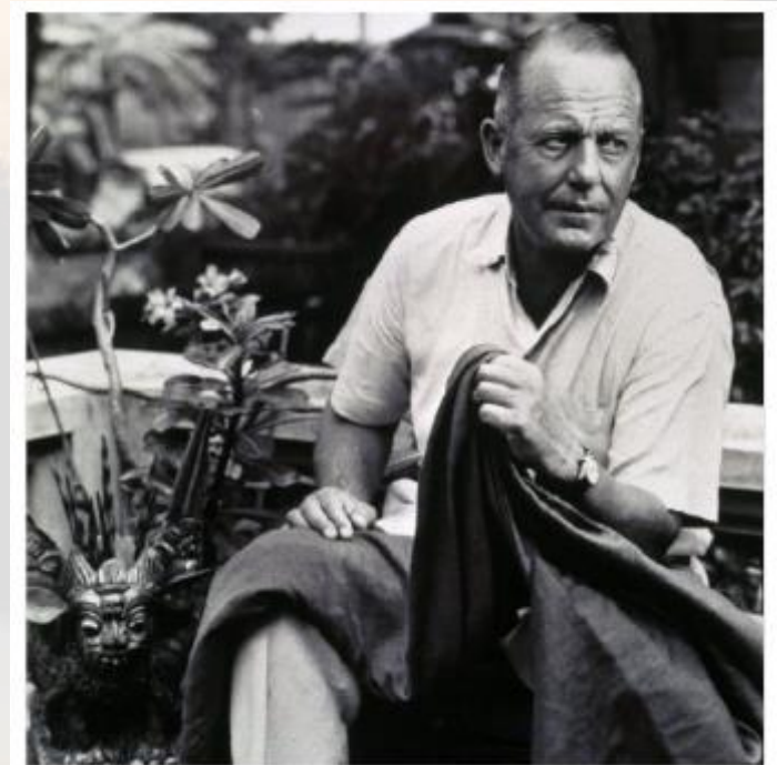
Grand amateur d'art, Jim Thompson a consacré une partie de sa vie à la défense du patrimoine culturel thaïlandais.