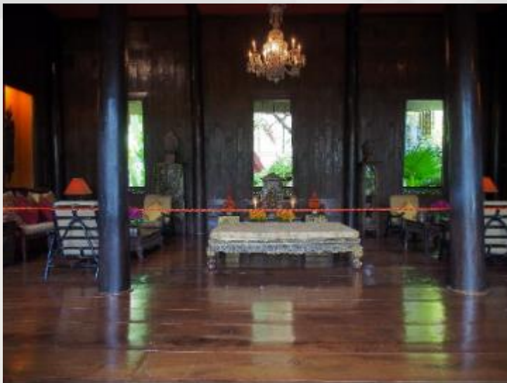
La maison de Jim Thompson abrite l'une des plus belles collections d'œuvres d'art thaïes.

Nous serons de retour à l'hôtel en fin d'après-midi vers 16h30 – 17h pour prendre un peu de repos avant le dîner.