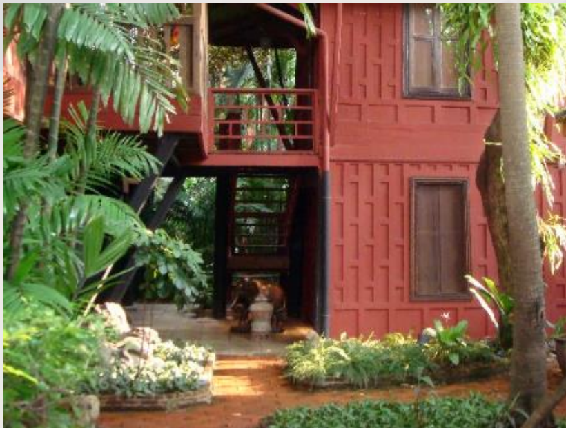
Les pavillons qui datent du XIXe siècle ont été reliés entre eux par des corridors.

Entre les appartements privés et la salle à manger est le salon, construit à partir d'une maison âgée de 100 ans en bois que Jim Thompson a achetée à la communauté musulmane Ban Krua juste de l'autre côté du canal. Les villageois de Ban Krua étaient les premiers tisserands de la marque de soie de Jim Thompson. Jim Thompson avait l'habitude de ramer à travers le canal tous les jours, jusqu'à ce qu'il décide de construire une maison permanente ici.