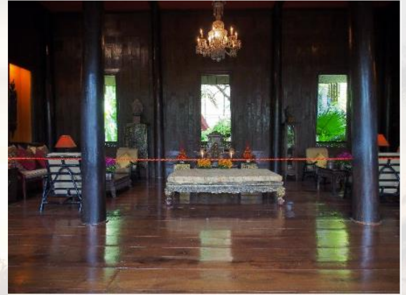
La maison de Jim Thompson abrite l'une des plus belles collections d'œuvres d'art thaïes.

Après la mystérieuse disparition de Jim Thompson, un administrateur nommé par la Cour, qui devint 10 ans plus tard la Fondation James HW Thompson, prit la direction de sa maison et de ses biens. Aujourd'hui, la marque Jim Thompson s'étend également à un centre d'art, boutique souvenir, restaurant et café, ainsi que des installations de banquets situés dans le même voisinage. Avec une terrasse en plein air au bord du canal, le Hall Araya élégamment aménagé accueille des rassemblements de 40 à 80 personnes, qu'il s'agisse d'une fonction corporative, d'une réunion, d'un défilé de mode, d'un banquet de mariage, d'une conférence de presse, de déjeuners privés ou de dîners.