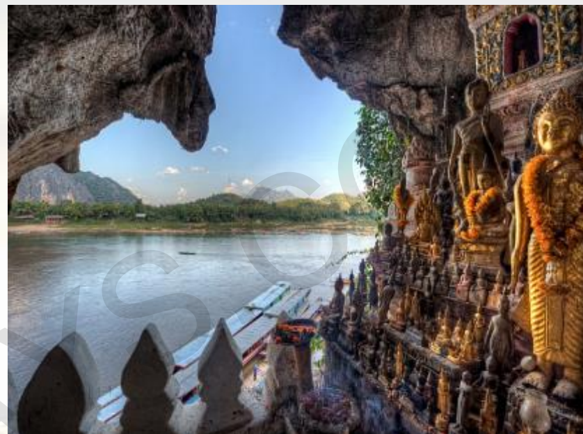
LES GROTTES DE PAK OU