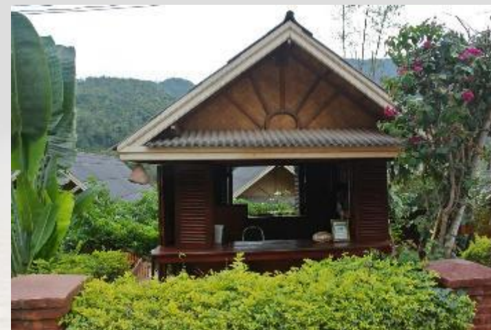
NOTRE HÔTEL A PAKBENG