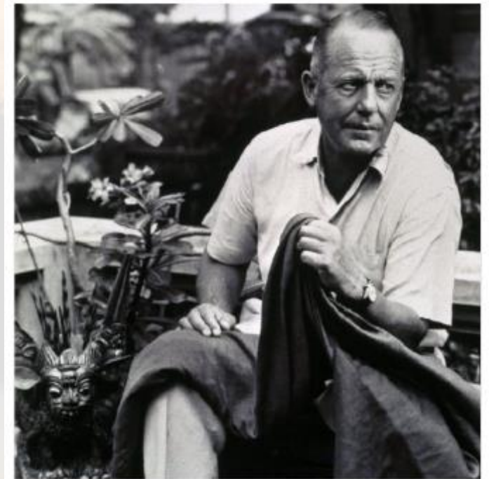
Grand amateur d'art, Jim Thompson a consacré une partie de sa vie à la défense du patrimoine culturel thaïlandais.