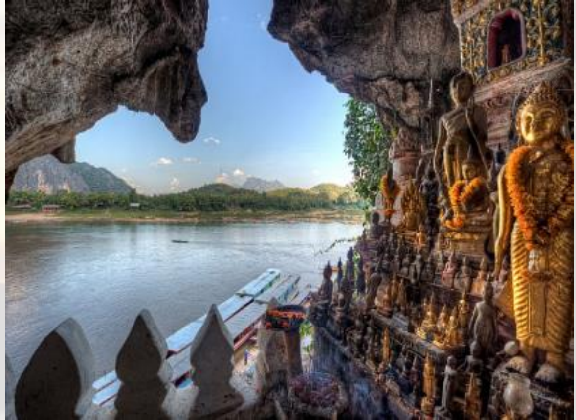
LES GROTTES DE PAK OU